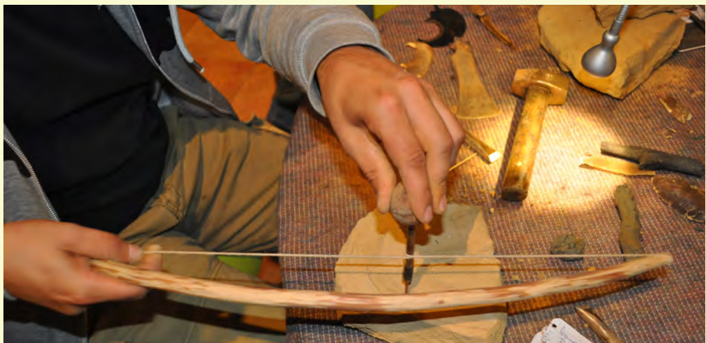
Stage di archeologia sperimentale su materiali preistorici

www.dssbc.unisi.it/it/ricerca/strutture-della-ricerca/laboratori/laboratorio-di-disegno-dei-manufatti-preistorici