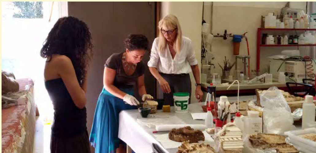
Stage di restauro dei reperti provenienti dagli scavi

perché gli studenti partecipano agli stage nei laboratori